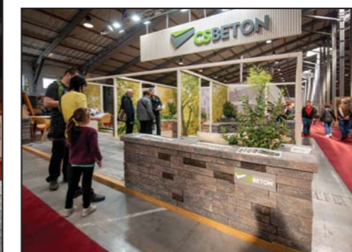
CS-BETON s.r.o. za poutavé ztvárnění expozice při představení prvků zahradní architektury