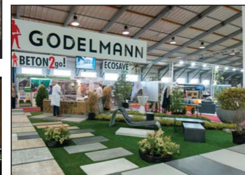
GODELMANN CZ, s.r.o. za inovativní pojetí expozice při prezentaci výrobků