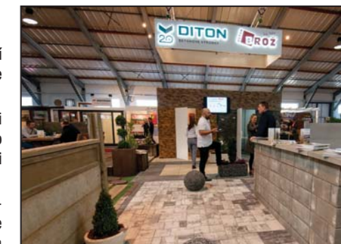
BETON BROŽ s.r.o. za elegantní představení moderních betonových povrchů a prvků zahradní architektury

Estetické ztvárnění expozic bylo v letošním ročníku opravdu vysoké, a tak nebylo vůbec jednoduché vybrat pouze jednoho vítěze. Proto se společnost ABF, a.s. rozhodla ocenit čestným uznáním v této soutěži i další skvělé expozice: