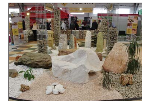
PIEDRA UNO a.s. za čisté a vkusné provedení expozice s důrazem na efektní představení nabízeného sortimentu