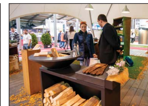
EVENT SELECTION s.r.o. za zajímavé představení výrobků v nadčasové expozici