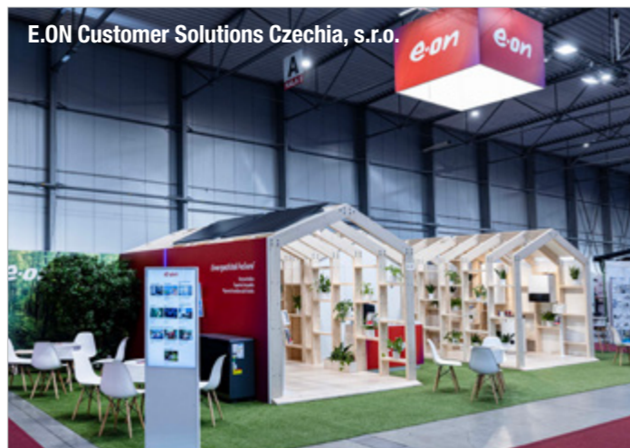
E.ON Customer Solutions Czechia, s.r.o.