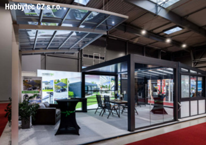
Hobbytec CZ s.r.o.