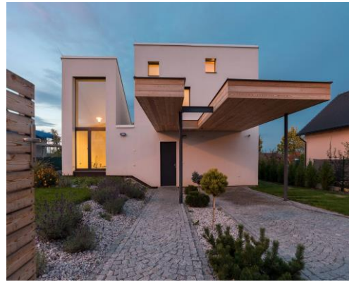
Dům na větrném kopci, novostavba rodinného domu