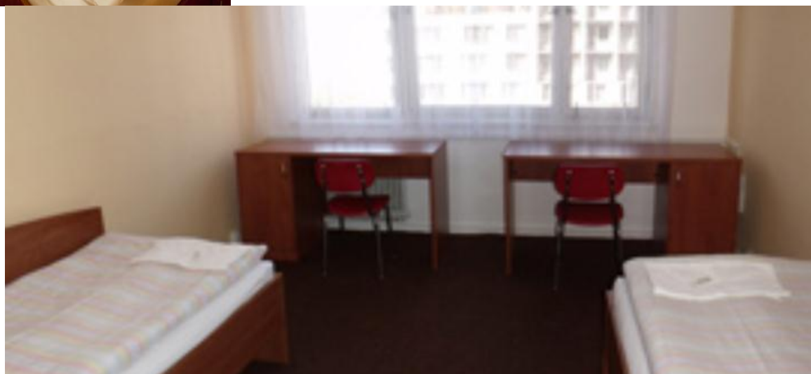
Jbytování ve dvoulůžkových pokojích se společnou koupelnou a WC pro 2 pokoje. Každý pokoj je vybaven nábytkem a