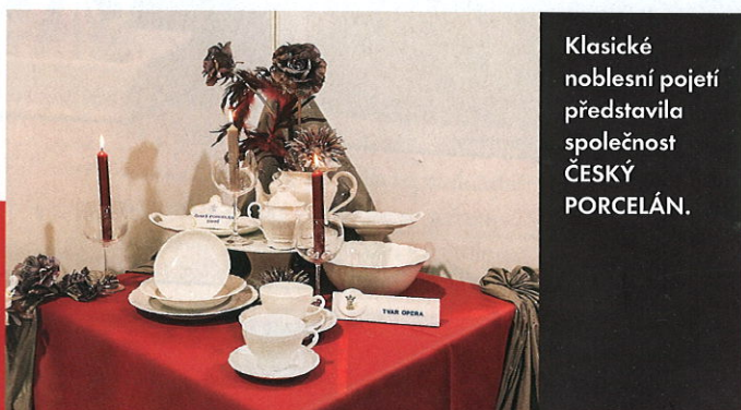
Klasické noblesní pojetí představila společnost ČESKÝ PORCELÁN.

Jednalo se o soubor odborných veletrhů FOR DECOR & PRESENT – FOR INTERIOR – FOR GASTRO & HOTEL, které se vzájemně tematicky doplňovaly a poskytly tak milovníkům kvalitního bydlení inspiraci, báječné nákupy i příjemné zážitky například formou doprovodných programů. Tuto veletržní událost zhlédlo celkem 30 866 návštěvníků, kterým představilo své působivé expozice 487 renomovaných firem a společností. Na výstavní ploše 26 300 m 2 bylo možno obdivovat širokou škálu dekorací a dárků, bytových doplňků, nábytku i gastro nabídky. To vše korunovaly novinky ze všech jmenovaných oborů, nejnovější trendy a také bohatý doprovodný program.