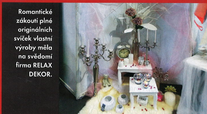
Romantické zákoutí plné originálních svíček vlastní výroby měla na svědomí firma RELAX DEKOR.