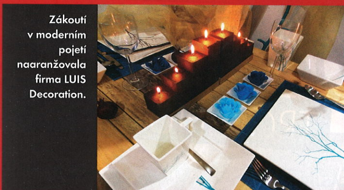
Zákoutí v moderním pojetí naaranžovala firma LUIS Decoration.